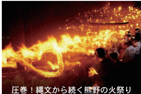
圧巻！縄文から続く熊野の火祭り